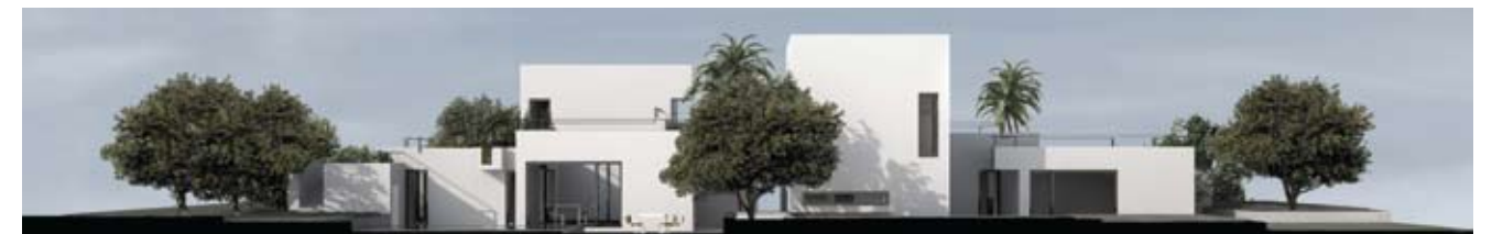
Dom w Syrakuzach (Włochy)