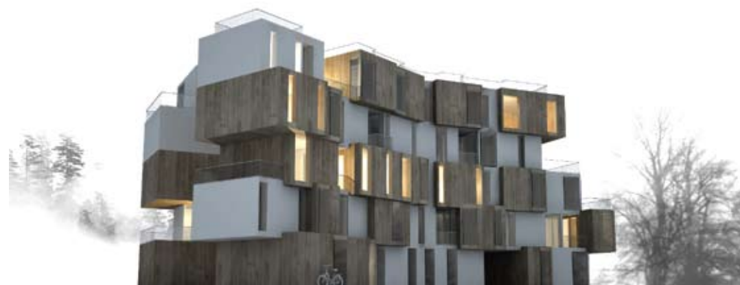
Budynek mieszkalny w Krakowie