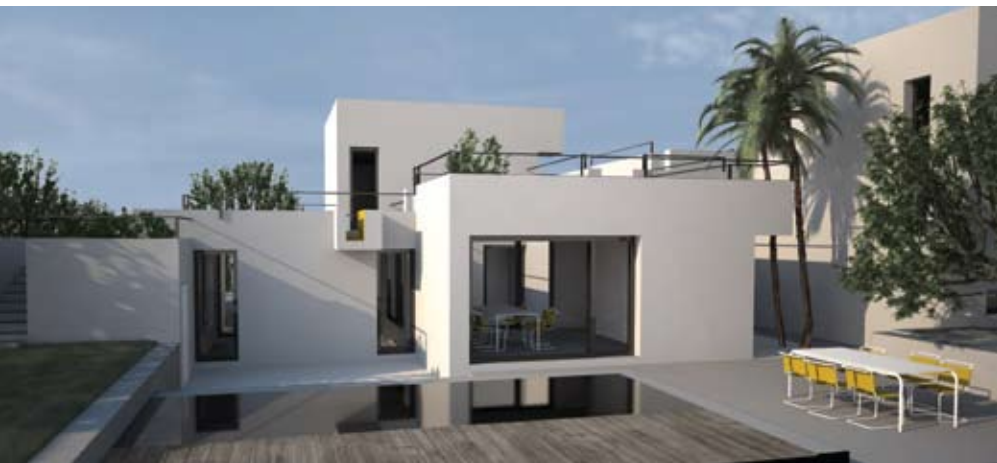
Dom w Syrakuzach (Włochy), źródło: AION

Kosmopolityczne osiągnięcia Aleksandry Jaeschke i współprowadzonej przez nią pracowni architektonicznej Aion ukoronowane zostały prestiżową nagrodą European Centre przyznawaną najlepszym projektantom młodego pokolenia. Co sprawia, że projekty Studia Aion są tak wyjątkowe?