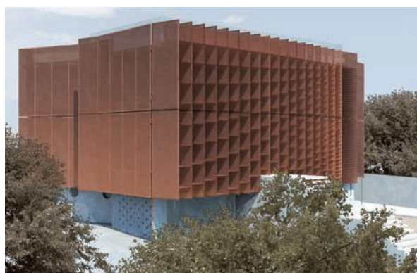
Plemmirio, restyling totale di un'abitazione per vacanze degli anni '60 sulla costa siracusana. Nello schema, il sistema di vele verticali, dimensionate e orientate per raccogliere le brezze marine in estate, garantisce il raffrescamento passivo, mentre le lamelle orizzontali, posizionate parametricamente, seguono il percorso solare e schermano durante le ore più calde.